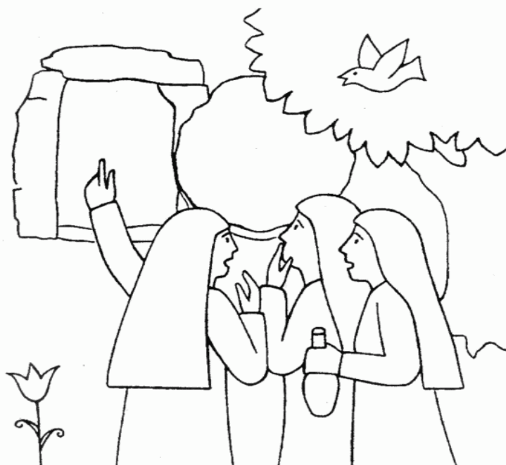
PRÁZDNÝ HROB Luk. 24, 1-12